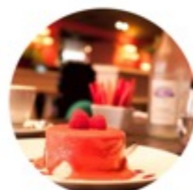
Кафе и рестораны