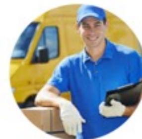
Курьеры и доставка