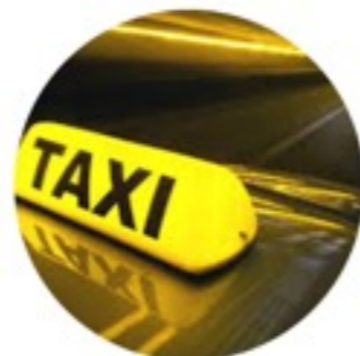
Такси и транспортные услуги