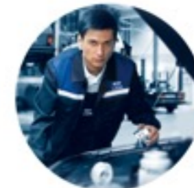
Сервис и ремонт